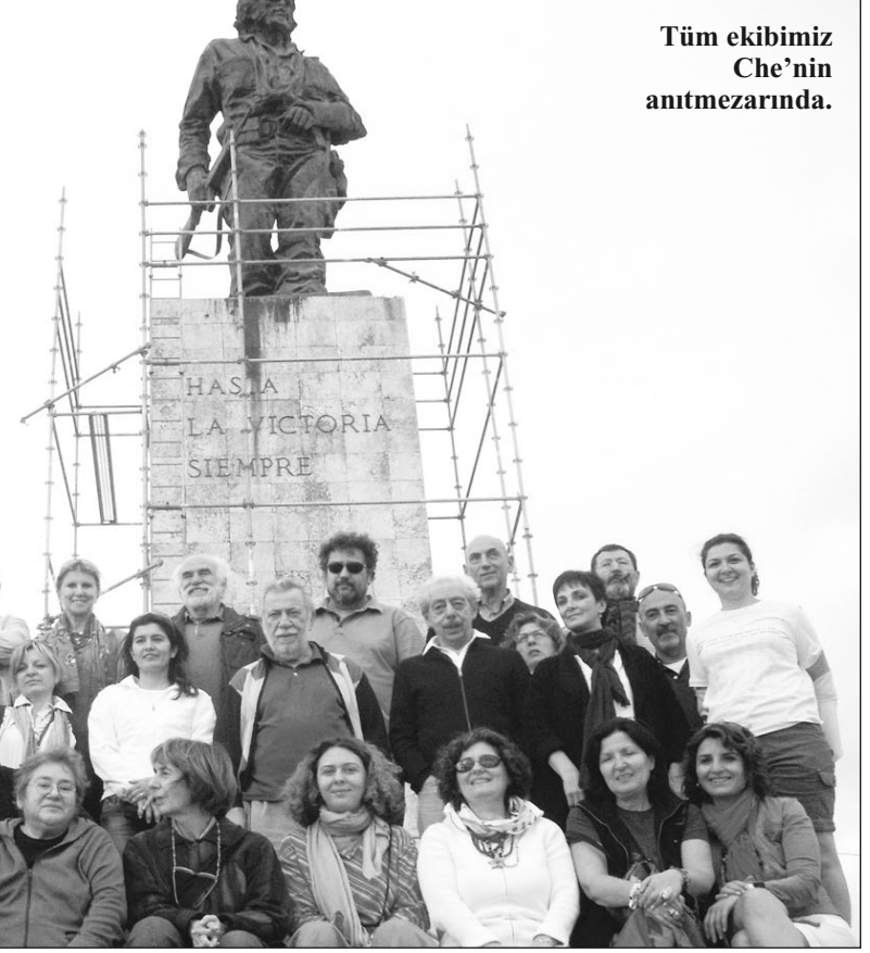
Tüm ekibimiz Che'nin anıtmezarında.